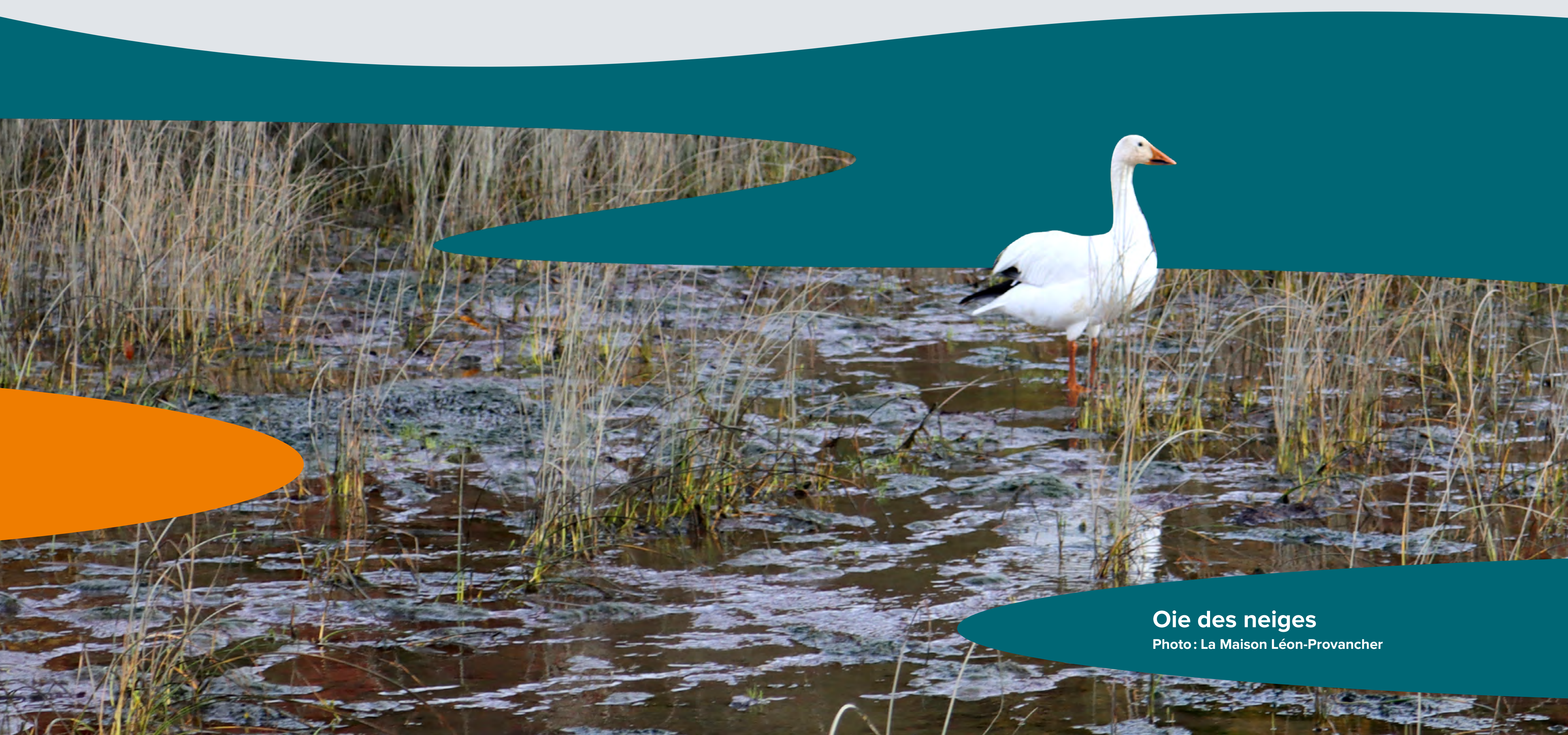
Oie des neiges

Faisant partie du paysage naturel québécois, ces oiseaux n'occupent pas seulement nos régions côtières. Les prairies, les forêts et les marais sont bénéfiques aux espèces de sauvagines. Ces oiseaux font partie intégrante de l'écosystème : ils se nourrissent de faune et de flore aquatiques et sont aussi au menu de nombreux autres animaux. Le déclin de leurs populations n'est pas étranger au déclin de la biodiversité en raison de la perte des habitats naturels.