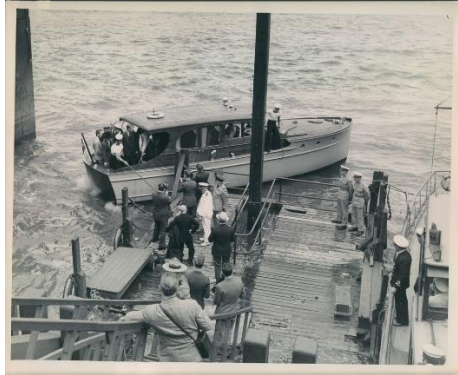
Jeffy Jan II , alors HM HC-54 en 1943